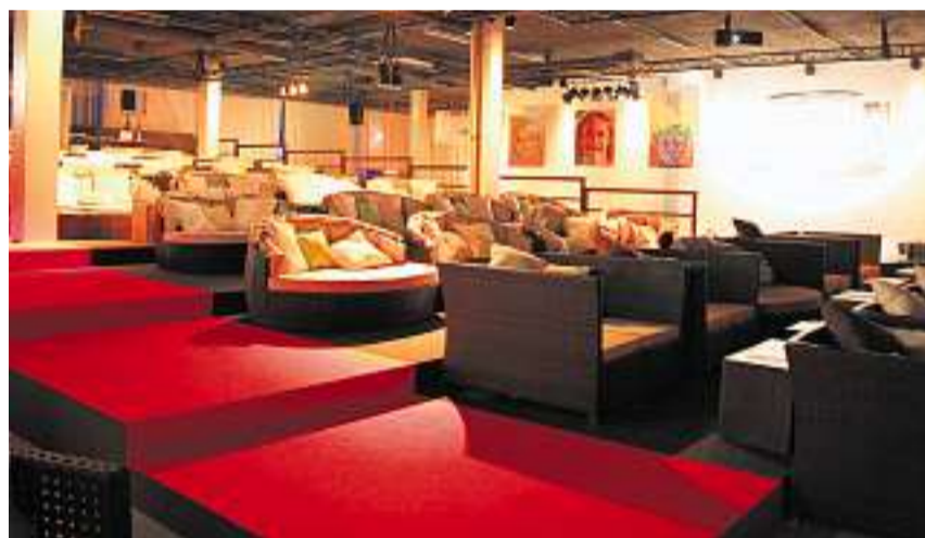
Das Lounge Kino im Joner Buech bietet Filmsspass für sämtliche Sinne.